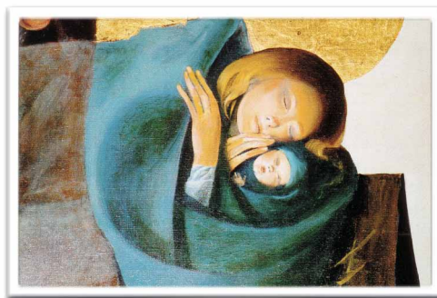
Arcabas, Nativité, détail